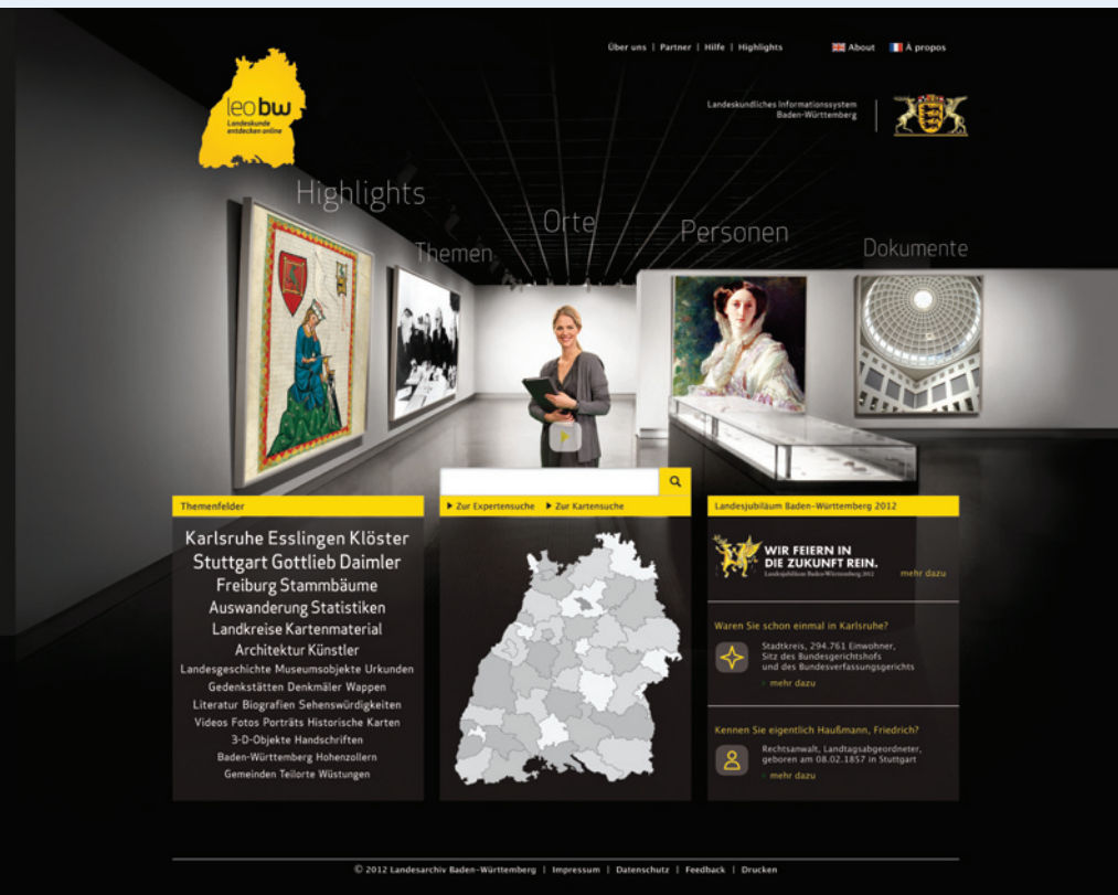
Abbildung 1: Die LEO-BW Startseite, der Zutritt zum landeskundlichen Informationssystem

Unter Federführung des Landesarchivs Baden-Württemberg realisiert die ISB AG dieses deutschlandweit wohl einmalige Projekt mit Know-how im Bereich Portale, Archivwesen, eGovernment und Geodatenverarbeitung.