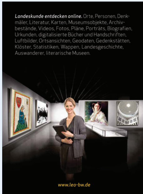
Abbildung 2: Inhalte des Portals

Gegenstand des Vergabeverfahrens 2010/11 für LEO-BW waren die Beschaffung, Entwicklung, der Aufbau und die Inbetriebnahme eines über das Internet zugänglichen landeskundlichen Informationssystems. Mit der technischen Realisierung des Projekts konnte im Januar 2011 begonnen werden. Die ISB AG hat dabei insbesondere folgende Leistungen erbracht: Projektmanagement, Erstellung Fachfeinkonzept zum Gesamtsystem, Softwareentwicklung inklusive Doku-