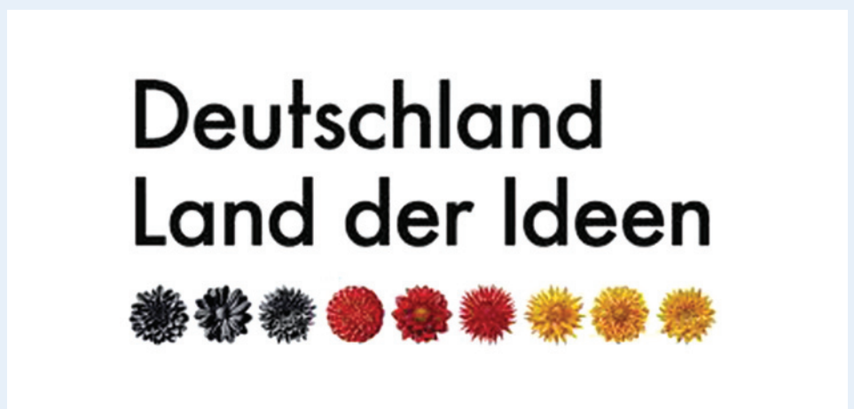
Abbildung 5: Ausgewählter Ort 2012

Jan-Helge Ulrich, Bereichsleiter Vertrieb ■